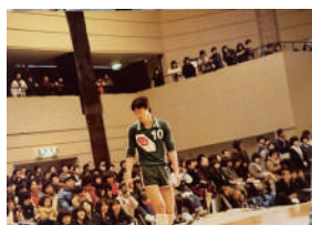
総合体育館で実業団の試合を間近で観戦しました

高校生の時の夏合宿は学校の教室に机をいくつも並べた上に布団を敷き、ベッド代わりにして泊まり、こっそり花火をしたり、夜の校舎で肝試しをしたり。夜更かししているのが見つかること怒られるので、見回りで来る顧問の先生の足音と部員との足音を区別出来るように部員はスキップね！なんて言いながらもしゃいでいた事を思い出しました。みんなワイワイ言って笑いながら過ごす時間のおかげできつい練習もなんとか乗り越えられたのだと思います。