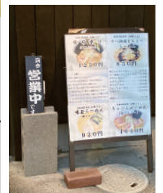
食事メニューはラーメンのみ

今回、我々は食べ納めとして何うかたちになってしまいましたが、今まで美味しいラーメンを提供してくださり、ありがとうございました!