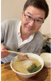
分厚くてジューシーなほろほろチャーシュー、本当に美味しかったです!