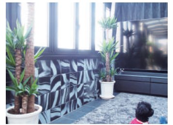
モノトーンで揃えた内装にグリーンが映えます！