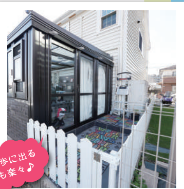
お散歩に出るのも楽々♪