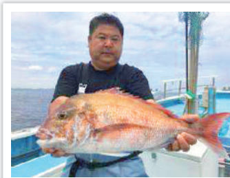
65cm / 5kgの真鯛です!

趣味は海釣り。夜中に家を出て下田や西伊豆、神津島などへ行き、釣ったものは家で自ら捌いて楽しんでいるそう。