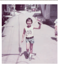
山形の蔵王温泉にて

相棒は小さな文字の時刻表。到着と出発を繰り返す時刻表示と路線図は見ているだけで飽きることなく想像が広がり、全国どこでも行けることを教えてくれます。当時の国鉄「原町田駅」で事前に購入した都内23区から山形市内までの切符は出発までの宝物。何度も何度も手に取って、行程の楽しい時間に想いを馳せていました。