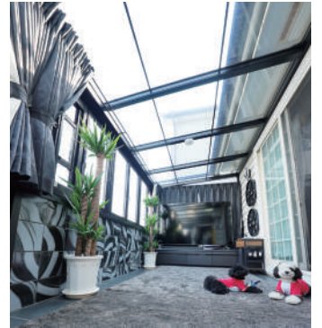
オーダーメイドで広さを出し、まるで増築並みのガーデンルームです！

A. 最初はワンちゃんたちの遊び場兼、半屋外のくつろぎタイム用のお部屋イメージだったのですが、今では私のメインルームとなっていますね。以前は2階に置いていた仕事用のデスクもこちらに移動したので、ずっとこの部屋にいます。ワンちゃんたちの様子も常に見れるし、窓を開け放せば半屋外気分も味わえるので良かったなと思います。