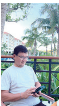
最近、『のんびり』が テーマの夏休み

ところで2007年まで日本での最高気温の記録は1933年山形県での40.8度でした。近年の日本の夏は尋常でない暑さが当たり前になってしまいました。エクステリアの見直しで解決、改善できることもたくさんあります。お気軽にご相談ください。