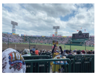
「社(やしろ)高校」対「日大三高」の熱戦

私の夏休み、それは神戸への帰省。すでに関東に住んでいる年月のほうが長いのですが、故郷に帰って関西弁で話をする。やっぱり一番落ち着くんです。そして最近必ず行くようになったのが甲子園球場。以前やってみたことと書かせてもらった高校野球観戦は夏休みの定番となりました。僕の大好きな暑い夏、大好きな高校野球を観戦しながら大好きなビール。本当に球児の皆さんには申し訳ないのですが、至福のひと時です。