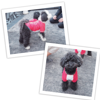
広いガーデンルームにワンちゃんたちも大満足。