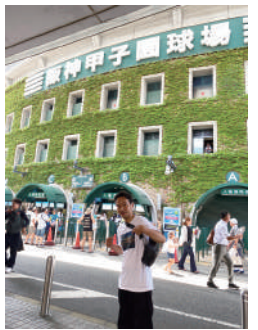
蕨のからまる甲子園ワクワクします

ちなみに今年は広島に行く予定です。これからも夏休みにはまだ行ったことのない場所をいろいろと訪れたいと思っています。でも甲子園球場はマストですよ。