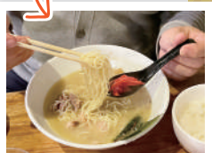
紅しょうがをスープに混ぜないのが僕のこだわり