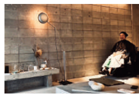
気持ちいいシャンプーに癒されています

ちよつと1年前くらいに独立されて表参道から田園調布に場所が変わったのですが、おひとりで行られるようになってからは、全てその方にやっていただけるので、プライベートなお話もでき、より贅沢な時間となりました。店舗の空間も美容師さんらしさが出ていて本当に素敵で、落ち着く香りの中、おいしいお茶に癒されながら楽しい時間を過ごさせていただいています。