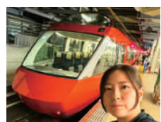
新宿駅にてGSEと記念撮影

快適さはもとより、あの車体もまたすごく魅力的ですよ。現在の最新型「GSE」の、あのパキッとしたオレンジ色のボディカラーが最高に格好良く、グッズも集めたりしています。ただGSEは大変人気が高いので、特に展望席はチケットの予約がなかなか取れません。