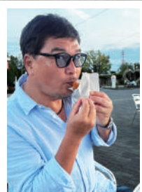
サービスエリアでのお楽しみ