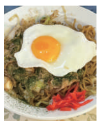
大好きな富士宮焼きそば

そうそう、コンビニで買うドリンクはカルピスウォーターではなく、「カルピス」エムエム(EMM)。子供のころ覚えた贅沢は忘れられることが出来ないようです。