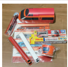
自慢のロマンスカーグッズです！

今ではロマンスカーでの車内販売がなくなりました。残念ですが、新宿駅の売店でお弁当や飲み物を買って、ゆったりと帰路の30分間を過ごす、気分はまさに小旅行なのです。