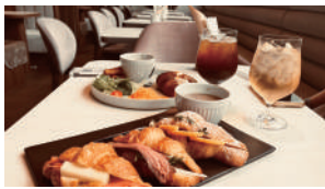
カット前の腹ごしらえ (この日は娘も一緒でした)

してもらおう贅沢な時間の幸せやありがたさを感じながら、次のプチ贅沢を楽しみに、日々の生活を頑張りたいなと思います。