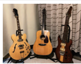
40年ぶりのギターです

出身地：東京都立川市 血液型：几帳面なA型 星座：双子座 干支：2025年の年男の巳年!