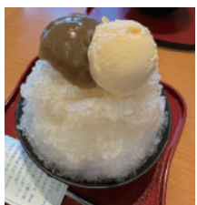
どこへ行ってもかき氷を探します

調べたところ、シャインマスカットでアレルギーが出る人がいるとのことなので食べすぎないようにしなくてはーと思ってしまうところですね。