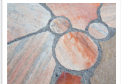
東神ハウスの展示場にある敷石の隠れミッキーです♪