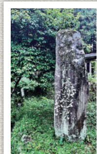
西山本門寺 信長の首塚