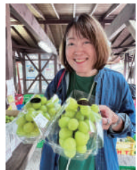
両手に花ではなくマスカット

大人になってから果物アレルギー持ちになり、リンゴや梨、桃、サクランボなど季節を感じられる果物が食べられませんが、少し前までは食べられていた物も年々ダメな物が増えていきます。しかし、シャインマスカットは数少ない大丈夫な果物なので、出始めると嬉しくてつい買ってしまいます。購入したらまず良く洗い、ザルに上げ一粒ずつハサミで切り離し、タッパーに入れておくのと長持ちするので少しづつ大事に大事に食べることにしています。今年は豊作と言うことで例年より安く手に入るのですが、まだまだ気軽に買える値段ではありません。