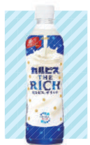
その名の通りのリッチな濃さがたまりません